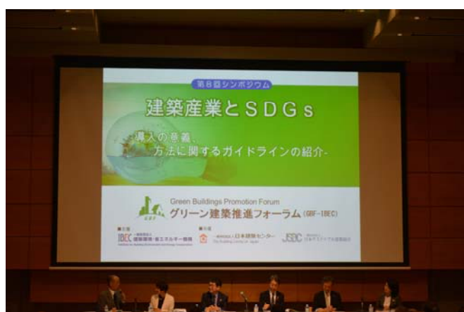
写真2 パネルディスカッションの様子