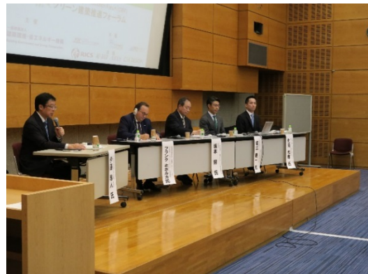
写真2 パネルディスカッションの様子