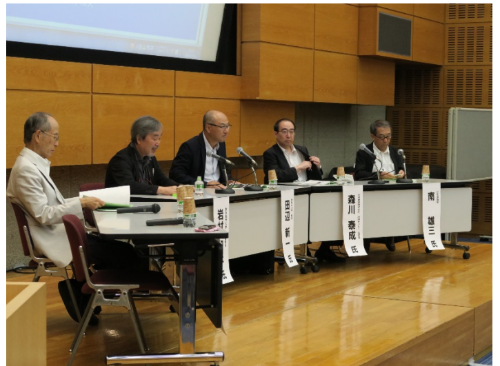
写真2 パネルディスカッションの様子